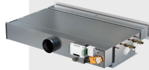
PARAGON AWC, jossa on toimilaite, ohjain ja venttiilitoimilaite

Tuotteessa on vakiona säätönuppi ja kaksi valinnaista vesiliitännäisvua, ja se on saatavana myös tehdasasennetuilla ohjaimilla.