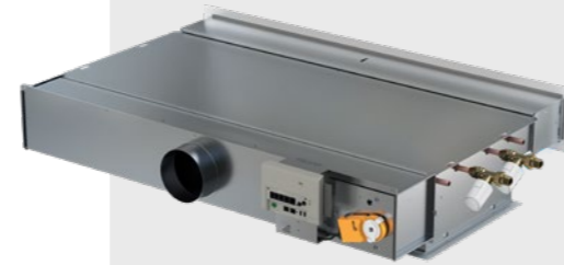
WISE Paragon, jossa on toimilaite, venttiilitoimilaite ja ohjain WISE CU

Tuotteessa on vakiona toimilaite, ohjain ja venttiilitoimilaite, ja se voidaan toimittaa myös lisäanturilla. Tuote voidaan myös integroida helposti rakennusautomaatiojärjestelmään Modbusin kautta.